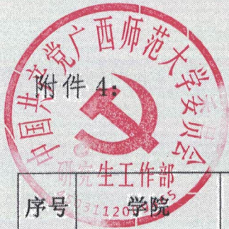
研究生学术论坛项目结题汇总表