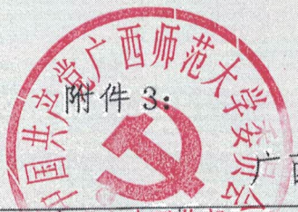
广西学位与研究生教育改革项目结题汇总表